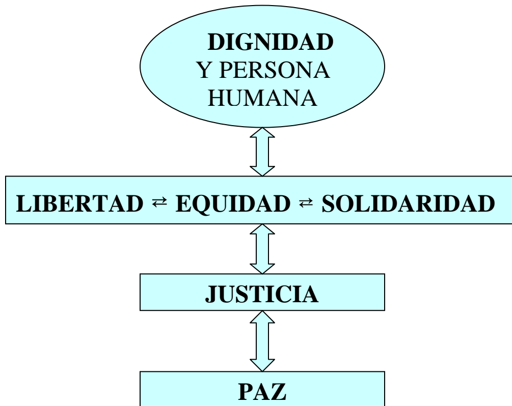
Gráfico 1: Valores Universales y su Interrelación

Creemos que el futuro de Cuba y de la Humanidad depende más que nunca de la convergencia de conciencias, de la generalización de los cambios internacionales, de la difusión e interacción internacional de las culturas, de la mundialización de la información y de la justicia social a nivel universal. Todo esto precisa una regeneración individual y una reconciliación colectiva que no puede lograrse más que concediendo gran importancia al eclecticismo y su corolario: la tolerancia.